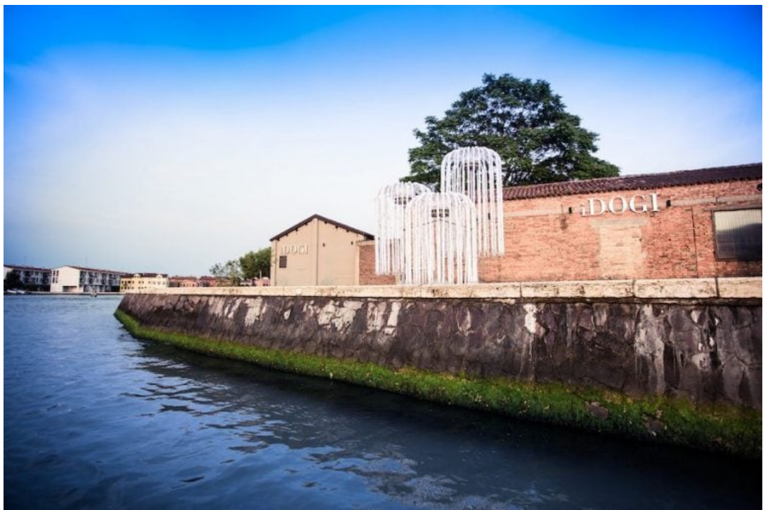
L'Albero di Luce