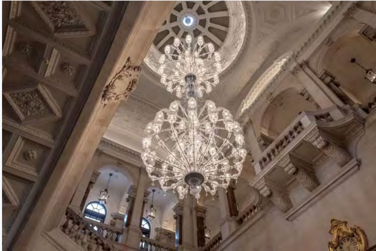
iDOGI Chandelier

Non ultime le tecniche produttive e il saper-fare da preservare e condurre nell'oggi, il tema della sostenibilità e l'heritage delle storiche aziende di Murano. In una Venezia che, tra XVII Biennale Internazionale di Architettura e 80ª Mostra internazionale d'arte cinematografica, esprime appieno la sua propulsione verso le discipline artistiche.